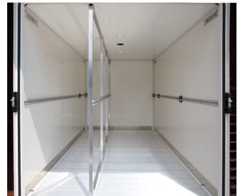
Zwei gesetzte Mittelkonsolen für vier Ladeabteile